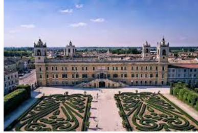
Reggia di Colorno