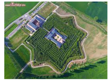
Labirinto delle Masone